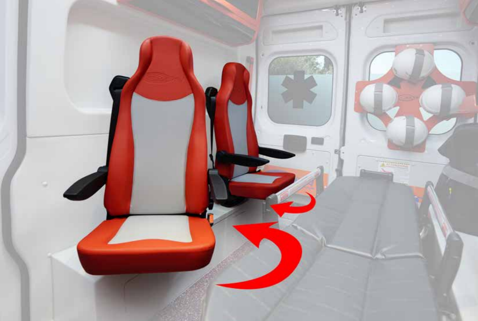
▲ Sedili girevoli