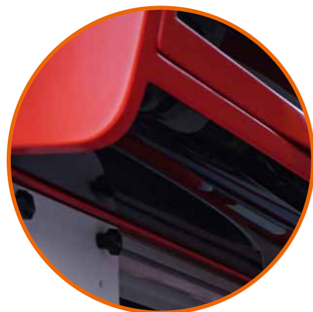
▲ Vetroresina nautico satinato per una sensazione tattile estremamente particolare

Modificando la combinazione degli arredi Orion riesce a comporre soluzioni ergonomiche assai diverse tra loro e a rispondere alle molteplici richieste degli operatori di settore.