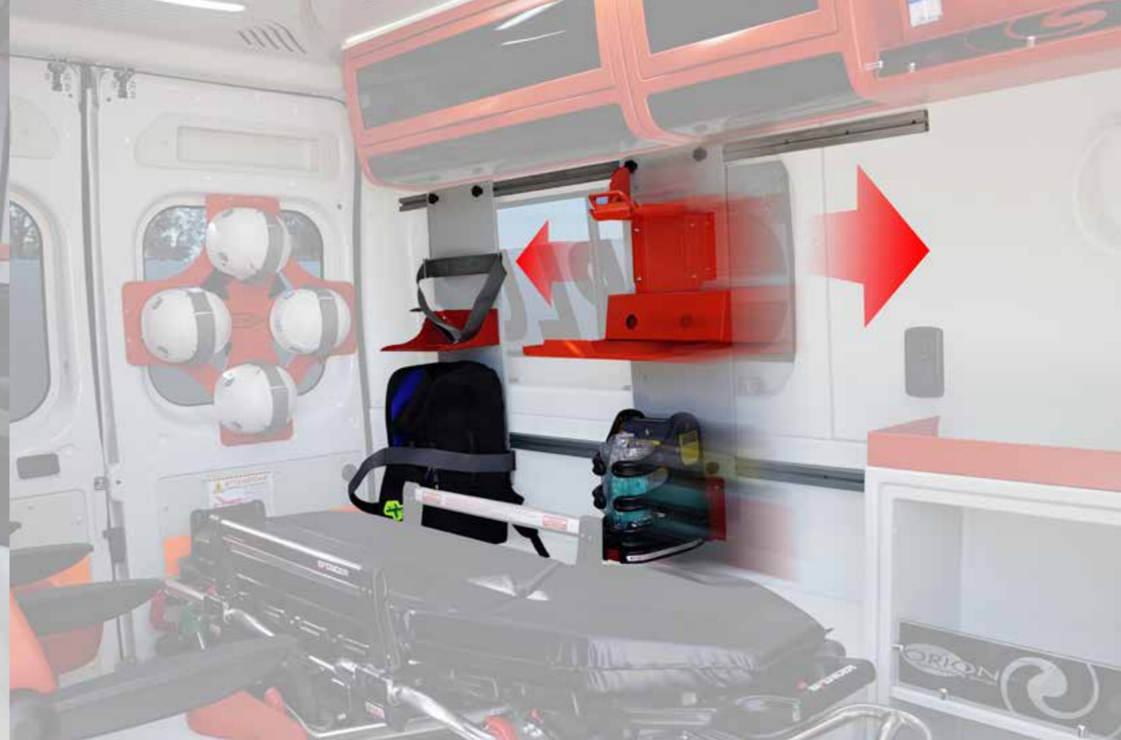
Rack regolabili e scorrevoli ▲

Domino nasce da un'importante studio condotto da Orion in collaborazione con l'Università degli Studi di Firenze. Fin dalla prima fase di progettazione l'obiettivo è stato offrire un prodotto con caratteristiche di sicurezza, ergonomia, design e flessibilità innovative.